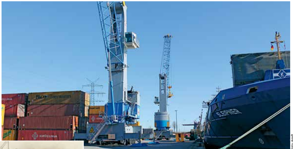
Gleich zwei moderne Hafenmobilkrane mit einer Hebefähigkeit von bis zu 125 Tonnen stehen am CTL für vielseitige und komplexe Umschlagarbeiten zur Verfügung

leistungsstarken Mobilkränen mit einer Hebefähigkeit von bis zu 125 Tonnen von Gottwald-Terex ausgerüstet, ideal für den auf dieser Anlage konzentrierten Container- und RoRo- so-