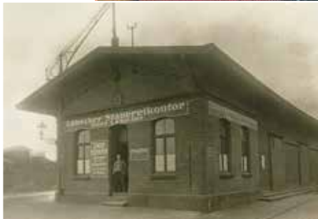
Urzelle: Mit einem Stauereikontor begann 1926 die heutige Firmengruppe Hans Lehmann KG

Prägend für alle Lehmann-Anlagen ist die gute Anbindung an die übergeordnete Infrastruktur wie Straße (Autobahn A 1), Bahn (Anschlussgleise) sowie auch an die Binnenwasserstraße. Die Firmengruppe setzt sich gemeinsam mit verschiedenen Partnern aus Lübeck aktiv für das Binnen-